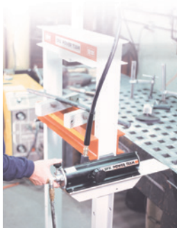
Commande manuelle pompe PA9H utilisée avec une presse capacité 25 Tonnes.