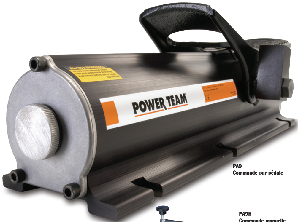
PA9 Commande par pédale