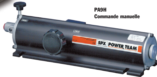
PA9H Commande manuelle